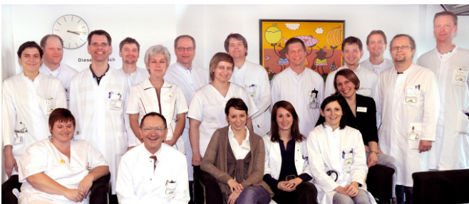
Ein Teil des fachübergreifenden (interdisziplinären) Teams der ITA.